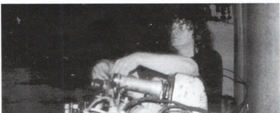
Een terugblik op een geslaagd herfstfestival 2002.