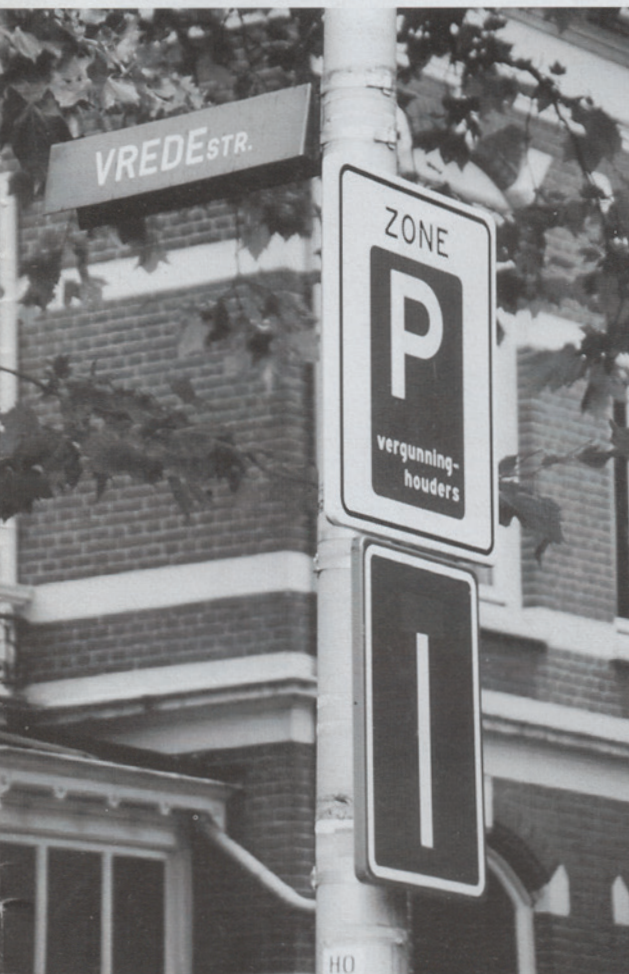
Nijmeegse Vredestraat

De Vredestraat in Nijmegen loopt dood. Deze stad is dus geheel klaar voor 2003. Jij ook? Al een gasmaskertje gekocht? Of een hoofddoekje?