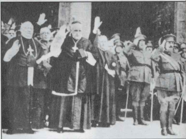
Spaanse bisschoppen brengen de fascistengroet (Spaanse Burgeroorlog)

De war-song is de zoveelste soort song. Songs gaan altijd ergens over. Liefde en oorlog hebben we nu gehad en wie weet waar de redactie nog meer mee komt. Maar in de kern gaat muziek nergens anders over dan over muziek. Politiek, moraal, religie en filosofie hebben in de muziek niks te zoeken. De woorden van een song zullen de muziek altijd van de essentie afhouden. Het scheelt al heel wat als de menselijke stem zich beperkt tot klank en alle woorden worden uitgeband. Ella Fitzgerald bijvoorbeeld maakte in de jazz de stem vrij van het woord, en zie tot welke Greetje Bijmas dat leidt.