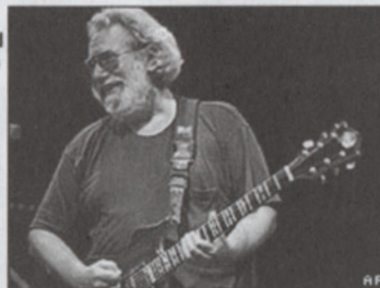
The Grateful Dead frontman died in 1995

Singer-guitarist Garcia died in 1995 of a heart attack, aged 53, while staying in a drug treatment centre.