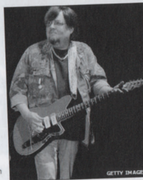
Asheton formed the group in Michigan in 1967

Formed in 1967, The Stooges were not well-received by critics or fans in their early days but their records, especially 1973’s Raw Power , were a key influence on punk.