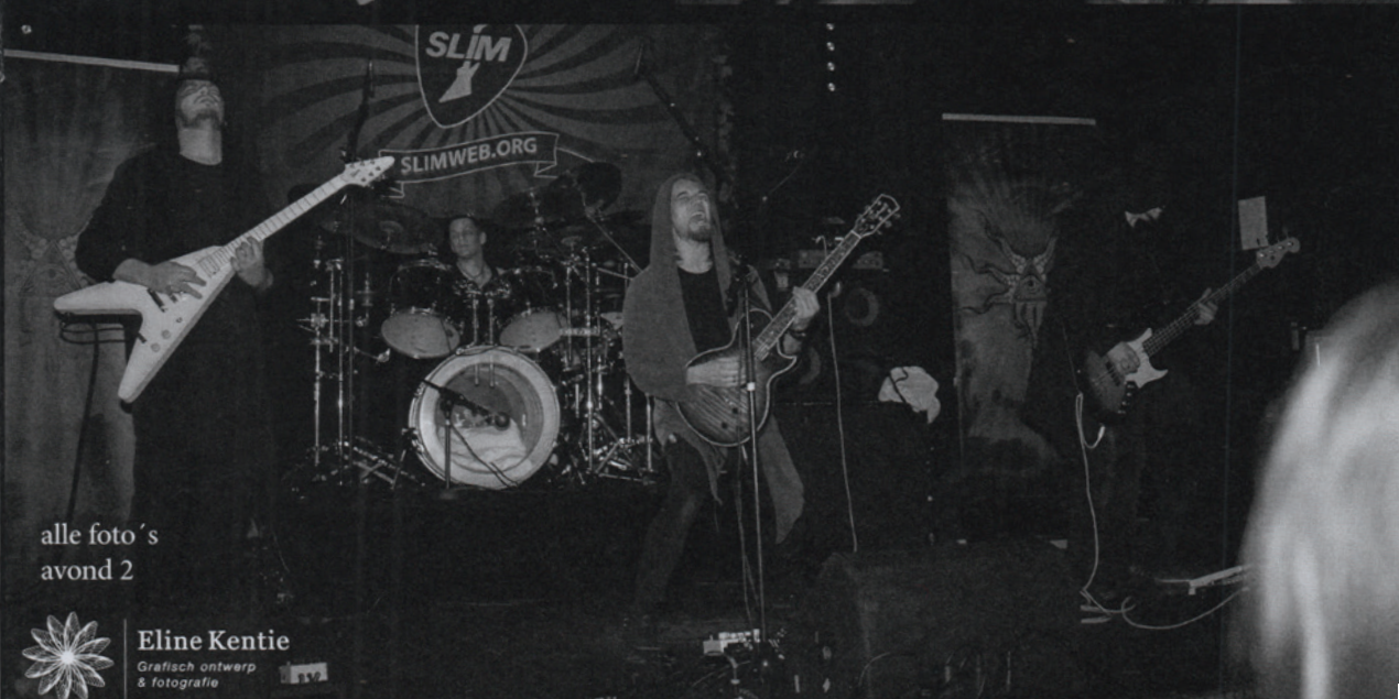
alle foto's avond 2